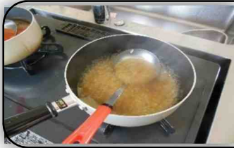
備蓄食品の工夫 「野菜リゾット」