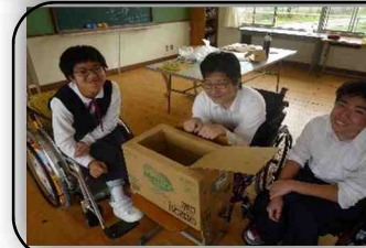
トイレ問題の解決 「段ボール トイレ」