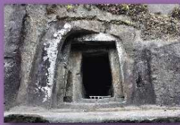
⑦石貫穴観音横穴 玉名市