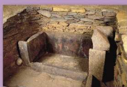
⑪塚坊主古墳 和水町