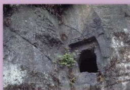
⑬大村横穴群 人吉市