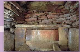
⑥田川内第一号古墳 八代市