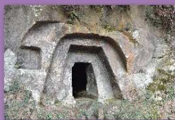
⑧石貫ナギノ横穴群 玉名市