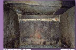
②宇賀岳古墳 宇城市