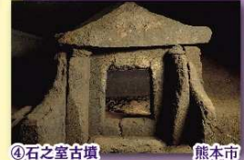
④石之室古墳 熊本市 熊本地盤からの復旧状況を説明します。石室内には入れません。