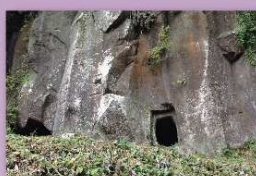
⑫京ガ峰横穴群 錦町