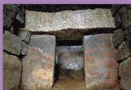
⑨永安寺東古墳 玉名市