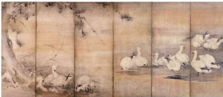
国指定重要文化財 伝宮本武蔵(芦雁図屏風)(左隻) 永青文庫所蔵(熊本県立美術館寄託)