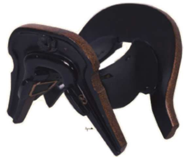
武蔵が手がけたという重厚な鞍 宮本武蔵(黒漆金銅牡丹文鞍) 松井文庫所蔵(八代市立博物館寄託)