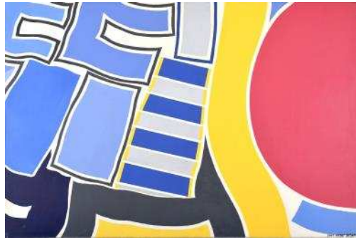
(作品#9) 2007 年 個人蔵