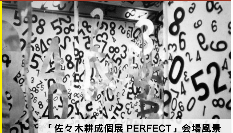
「佐々木耕成個展 PERFECT」会場風景 1965年