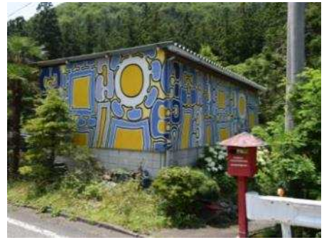
佐々木耕成による壁画 2018 年撮影