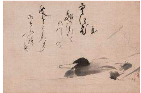
宮本武蔵筆・鳥丸光広賛(遊鴨図) 岡山県立美術館所蔵11/16から展示

この特集展示では、永青文庫所蔵の武蔵関連作品に加え、松井文庫に伝来した作品も一堂に展示し、剣術修行や指南のみならず、書画にもいそしんだ武蔵の晩年と、当時の熊本にスポットをあてます。また、岡山県立美術館の武蔵コレクションも特別展示。この秋、選りすぐりの武蔵作品が熊本に勢揃いです!!!