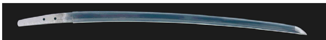
細川忠興の愛刀、歌仙兼定《刀 銘 濃州関住兼定作》永青文庫所蔵