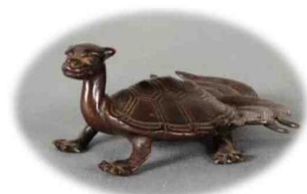
《銅製玄武文鎮》永青文庫所蔵

細川家のお殿さまの武器武具やお姫さまの雛飾り、その他さまざまな道具の中から「小さなもの」に着目して紹介します。当時の人々の細部に至るまでのこだわり、思わず「かわいい!」、「かっこいい!」とつぶやいてしまう感動をお届けします。