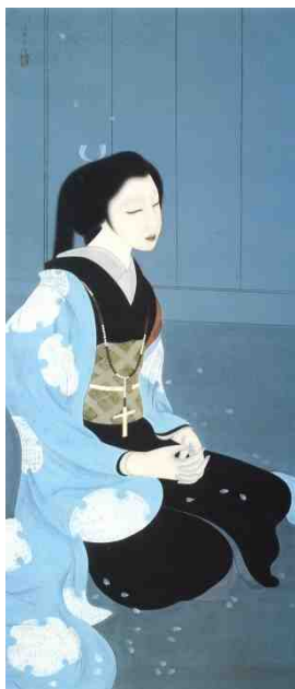
橋本明治 《ガラシヤ夫人像》 島根県立美術館蔵

本展では、戦国乱世の激動と華やかな桃山文化を時代背景としつつ、ガラシヤの動静を示す歴史資料やゆかりの品々でガラシヤの実像に迫るとともに、彼女を題材とした絵画や文学からガラシヤイメージの歴史的変遷も跡づけます。