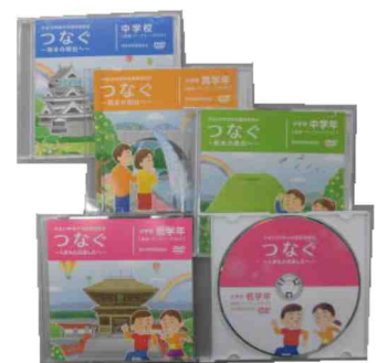
画像及びワークシートを収録したCD