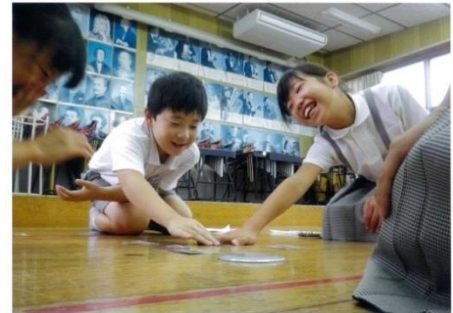
フォトコンテスト最優秀賞：笑顔

学校、地域及び家庭での教育に関する活動を撮影した写真189点のうち、最優秀賞、優秀賞及び特別賞に輝いた8人を表彰しました。