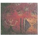
頭に冠をつけた人物像 (石屋形の石壁)