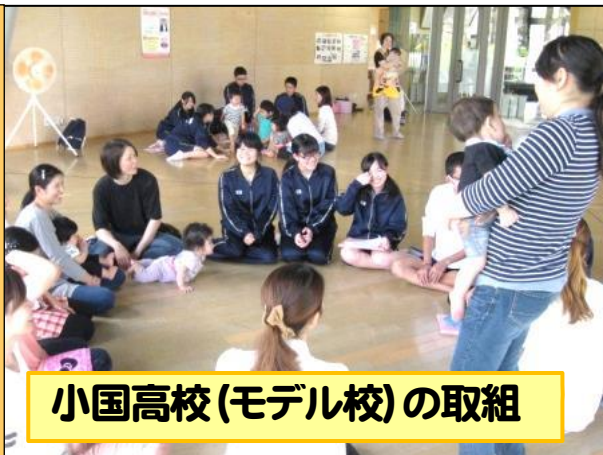
小国高校(モデル校)の取組