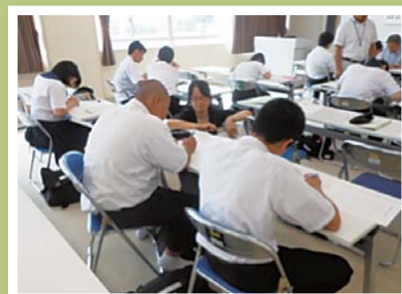
西合志中学校 地域未来塾