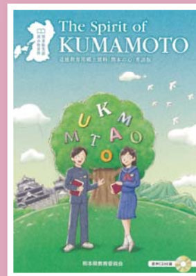
「熊本の心」英語版 The Spirit of Kumamoto