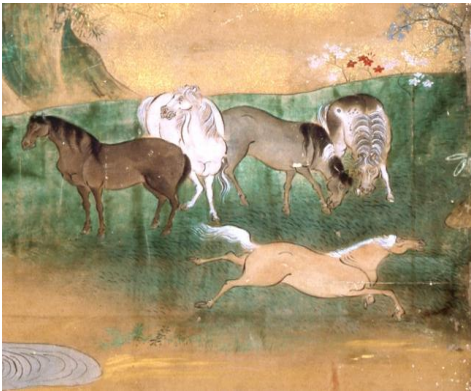
狩野探信守政筆《牧馬図屏風》部分 永青文庫蔵

古代より人々と関わりの深かった馬は、いろいろなかたちで造形化されてきました。平成26年は午年ということもあり、新年最初の展覧会として、細川家に伝わる装飾された馬具や馬の姿を描いた屏風など、馬にまつわるさまざまな作品を展示します。