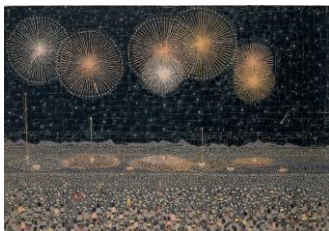
山下清《長岡の花火》©清美社

貼り絵をはじめ、ペン画、油彩、水彩画などの画業とともに、放浪日記や数々の遺品を 紹介し、山下清の真の姿に迫ります。