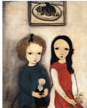
藤田嗣治《2人の少女と人形》個人蔵 ©ADAGP, Paris & JASPAR, Tokyo, 2013 E0459

■観覧料：一般 1300 円(1000 円)、高・大学生 800 円(500 円) ( ) は前売・20 名以上の団体料金、 中学生以下は入場無料、障がい者手帳をお持ちの方無料