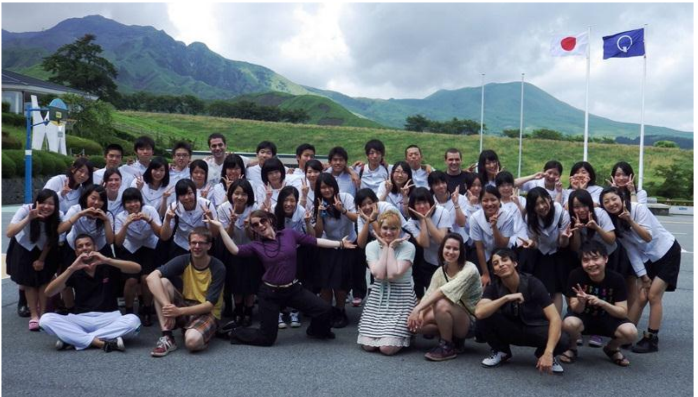
写真：熊本北高等学校：英語科合宿の様子（詳細は P.8 に掲載）