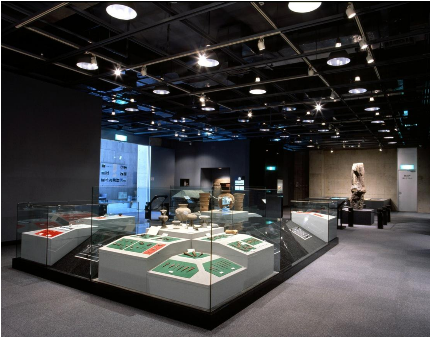
写真は 18～19 ページに記事を掲載している県立装飾古墳館の古墳室の様子です