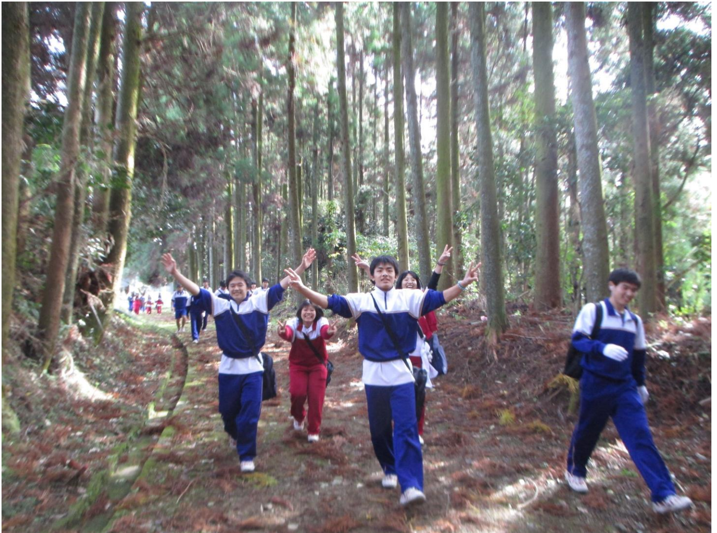
(P.12 南関高等学校 「『豊前街道』時空えんそく」の様子)