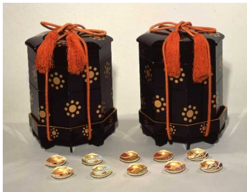
＜九曜紋蒔絵貝桶＞（前期展示）