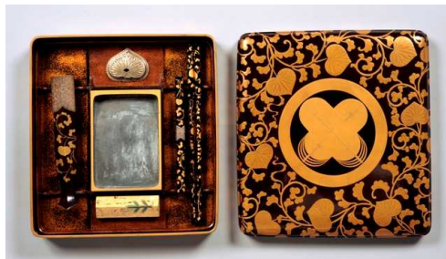
＜違鷹羽紋葵唐草蒔絵硯箱＞（後期展示）