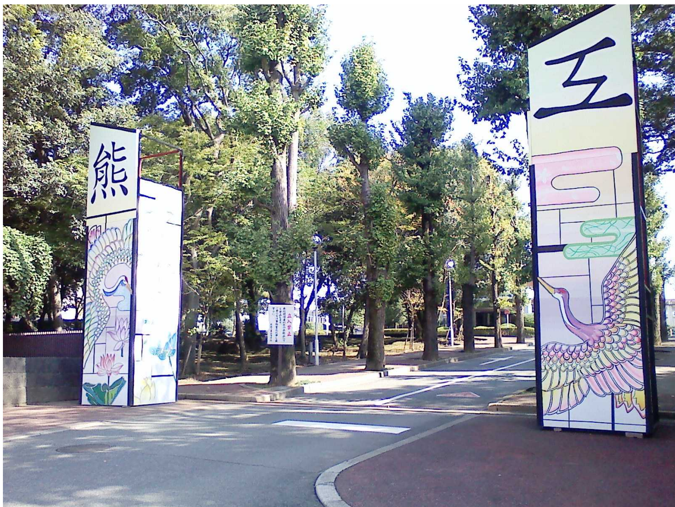
(熊本工業高等学校正門前)