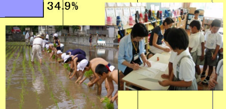
文部科学省 学校支援地域本部調査より