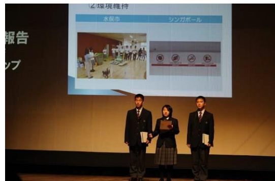
海外視察研修報告（シンガポール）