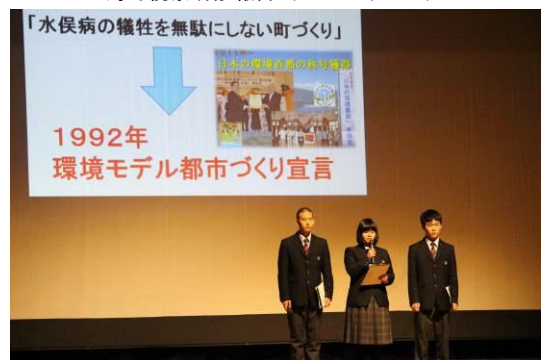
活動事例発表（水俣ACT I）