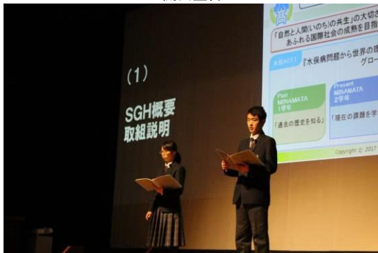
SGH事業概要および取組説明