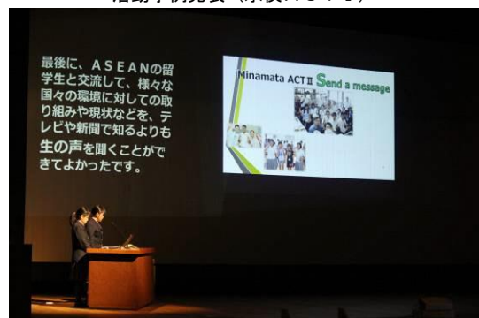
活動事例発表（水俣ACT II [慶應義塾大学との連携事業]）