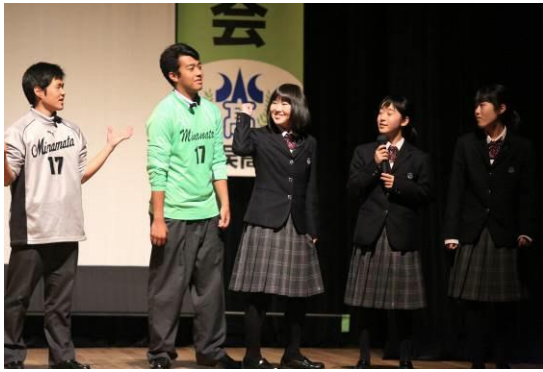
活動事例発表（水俣ACTⅡ[水俣市ガイド]）