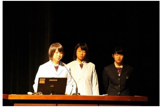
活動事例発表（水俣ACTⅡ[水俣市フィールドワーク]）