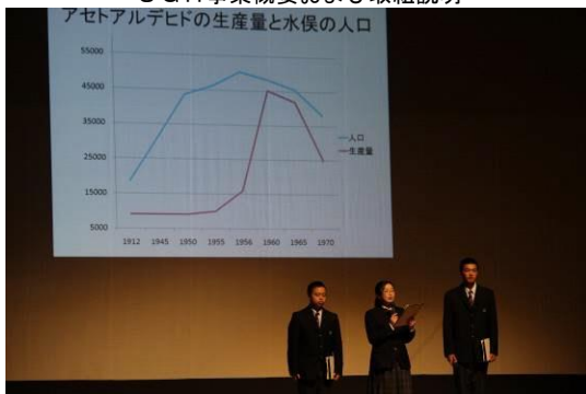
活動事例発表（水俣ACT I）