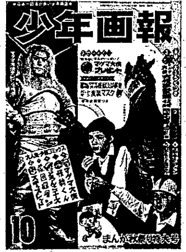
「少年画報」昭和41年10月号 少年画報社