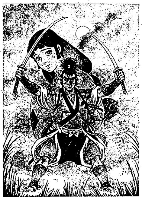
宮本武蔵とおつう ©川崎のぼる