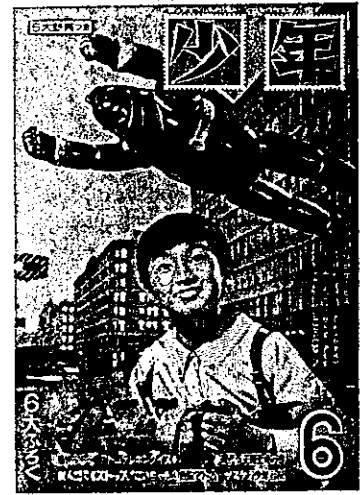
「少年」昭和39年6月号 光文社